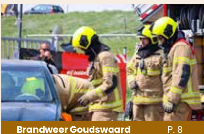
Brandweer Goudswaard P. 8