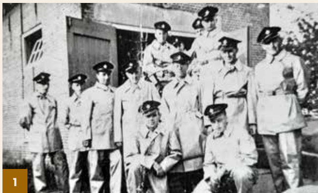
Foto 1: De brandweergarage was na de Tweede Wereldoorlog tot c.a. 1960 gevestigd naast de molen van Goudswaard. Op de foto staat het korps aangetreden in gloednieuwe bluspakken. Deze bluspakken waren door de kleermaker van Piershil vervaardigd van linnen van een sperballon uit de 2e wereldoorlog. De sperballon was door iemand uit het riet bij de gorzen uit Goudswaard meegenomen. Hij kwam waarschijnlijk uit Engeland en is daar losgeraakt en met een storm heel de Noordzee overgestoken. Het korps had er voor die tijd geweldige bluspakken aan.