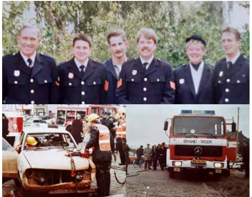
Foto's uit de oude brandkast...