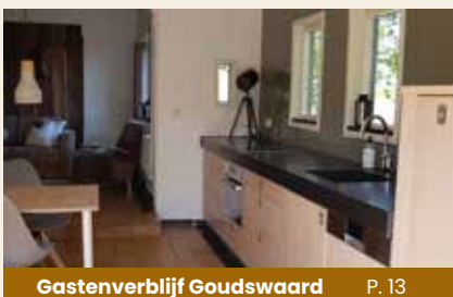
Gastenverblijf Goudswaard P. 13