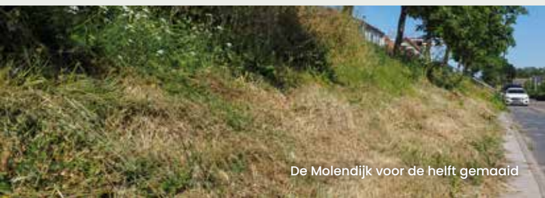
De Molendijk voor de helft gemaaid

In zowel de digitale als papieren media is het te lezen geweest, de Gemeente Hoeksche Waard gaat het groenbeheer aanpassen. De gemeente gaat binnen de bebouwde kommen waar mogelijk een ecologisch beheer toepassen, om planten en insecten meer ruimte en kansen te geven. Begrijpelijk dat dit niet van de ene op de andere dag kan plaatsvinden, maar de eerste stappen worden gezet.