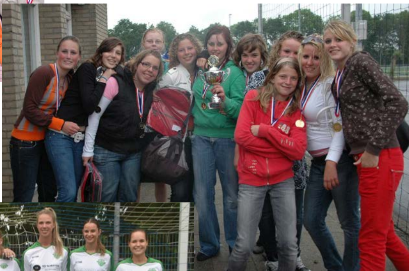
Mz in Noordwijkerhout op 28 mei 2007 met beker 2.