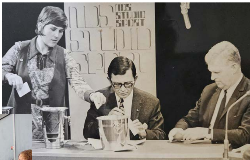
Loting eerste ronde van de KNVB-beker op woensdag 1 december 1971.