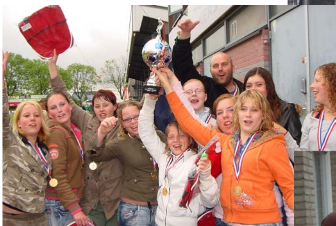
Mz in Rijswijk op 25 mei 2006 met beker 1.